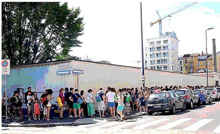
IN CODA La lunga attesa ai cancelli dei Bagni Misteriosi

IL TEMPO INCERTO NON HA PERMESSO DI RAGGIUNGERE IL RECORD DEL 2015 MA È STATA REGISTRATA UNA BUONA AFFLUENZA