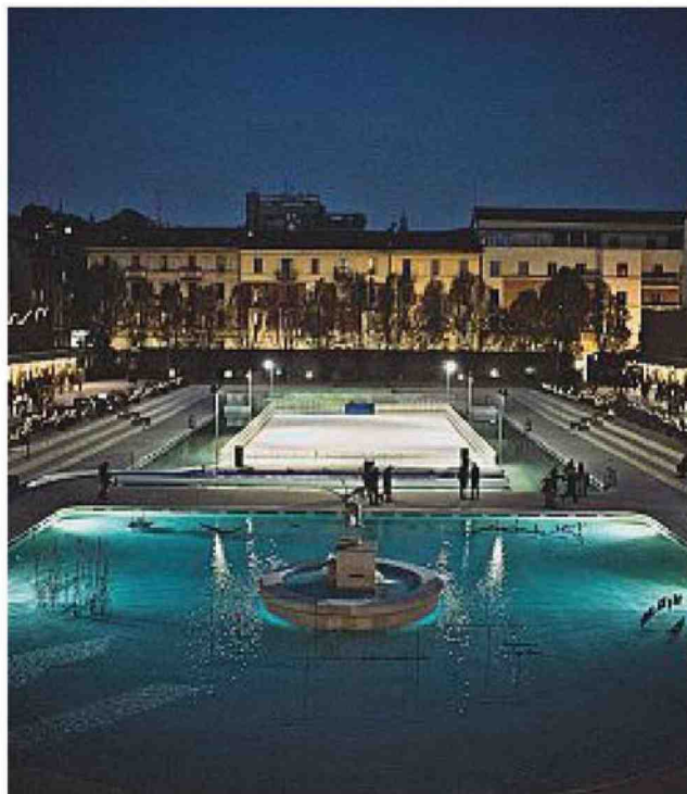
La pista di pattinaggio dei Bagni Misteriosi , nel complesso del Teatro Parenti , a Milano